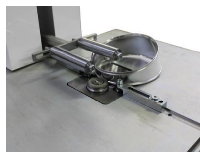
Esecuzione con dispositivo Mani libere